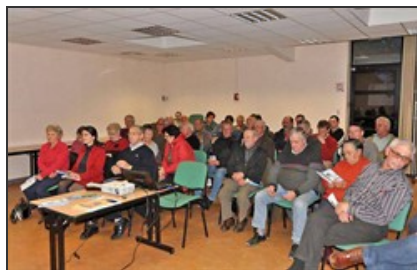
Les bénévoles de l'association Cheval, musique et traditions ont découvert l'affiche et le programme de l'édition 2012, au centre de ressources.

La Fête du cheval aura lieu dimanche 1 er juillet, sur le site du Vauvert. L'affiche et le programme ont été présentés lundi 26 mars aux bénévoles de l'association Cheval, musique et traditions. Ils sont également les acteurs de la fête.